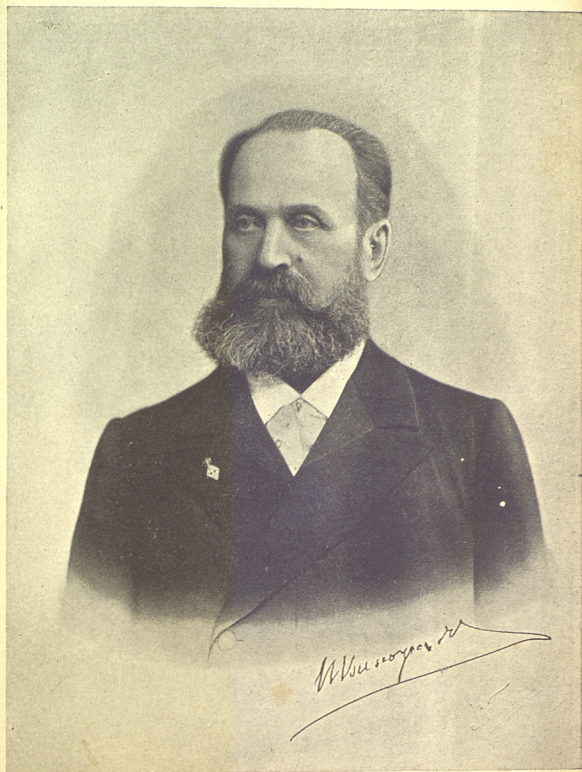
Иван Василѣвич Виноградов.