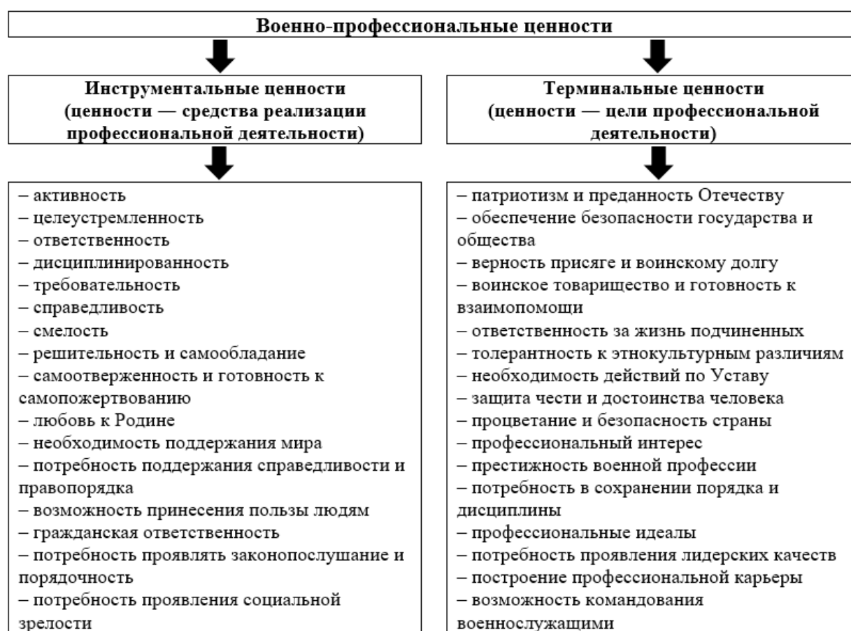
Рис. 2. Классификация военно-профессиональных ценностей курсантов вузов Росгвардии

самоуважением, смелостью, инициативностью, готовностью к рефлексии [9].