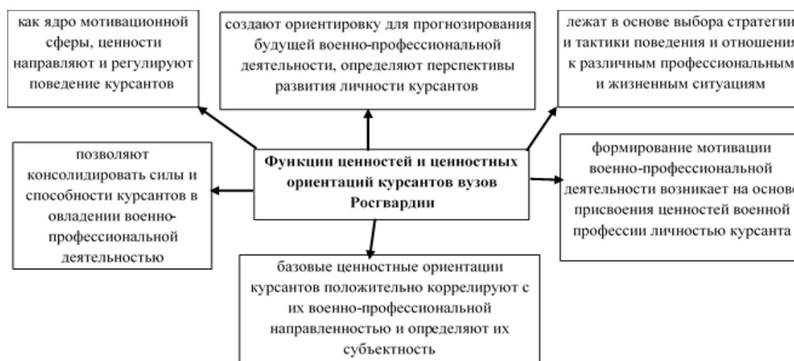
Рис. 1. Функции ценностей и ценностных ориентаций курсантов вузов Росгвардии

осмысления бытия, ведущих к совершенствованию личности в процессе ее развития» [11, с. 125].