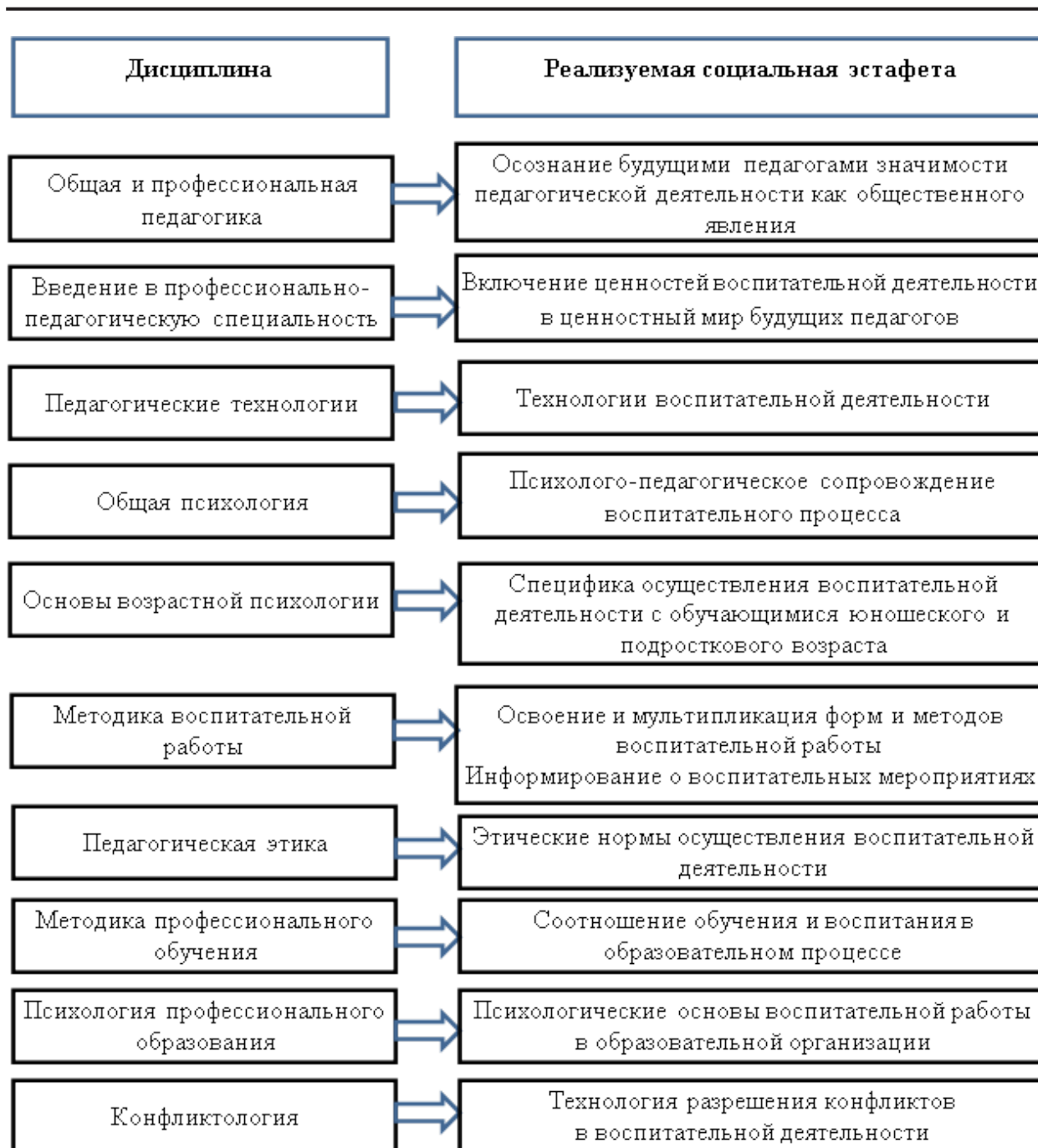
Рис. 3. Схема реализации социальных эстафет в ходе освоения дисциплин психолого-педагогического цикла