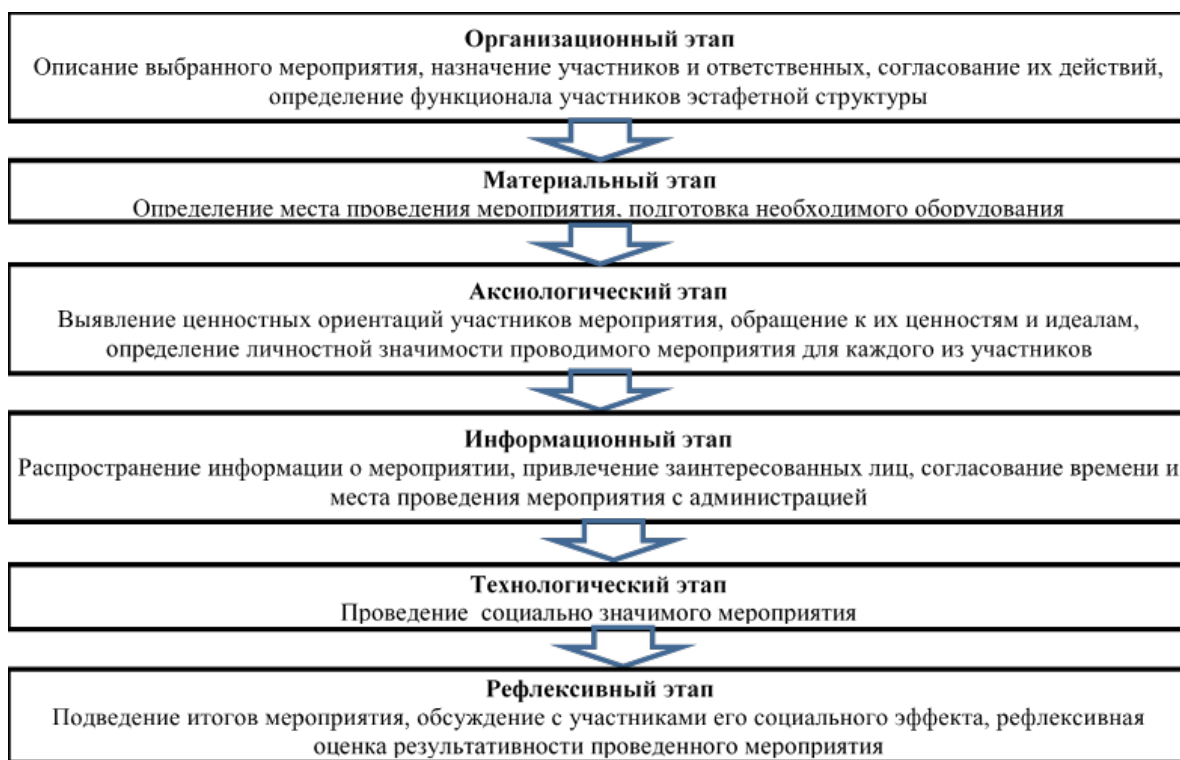
Рис. 1. Этапы преобразования социальной эстафеты в эстафетную структуру

Воспитательную деятельность в вузе, возможно представить как огромное количество