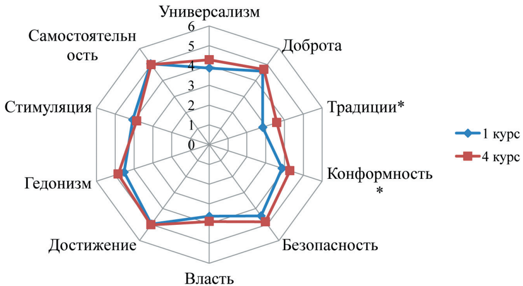
Рис. 2. Сравнительный анализ выраженности типов ценностей на уровне нормативных идеалов в группах 1-го и 4-го курсов. * — значимые различия