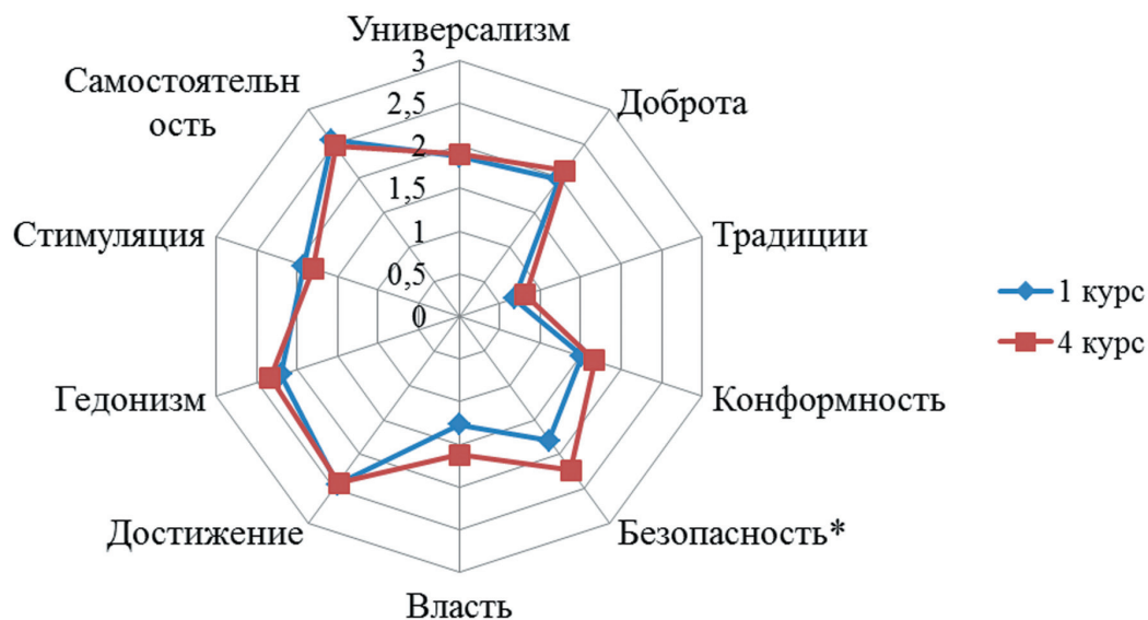
Рис. 3. Сравнительный анализ выраженности типов ценностей на уровне индивидуальных приоритетов в группах 1-го и 4-го курсов. * — значимые различия