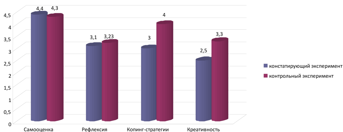
Рис. 1. Сравнительная характеристика компонентов мотивации саморазвития у подростков (среднее значение) в экспериментальной группе. Констатирующий и контрольный эксперименты

Анализ результатов подтверждает результативность преобразующего эксперимента. Стоит отметить, что эксперимент проводился в экспресс-режиме (10 занятий), потому существенных изменений по всем показателям не произошло, но в целом отмечена положительная тенденция изменений в структуре компонентов-индикаторов мотивации саморазвития.