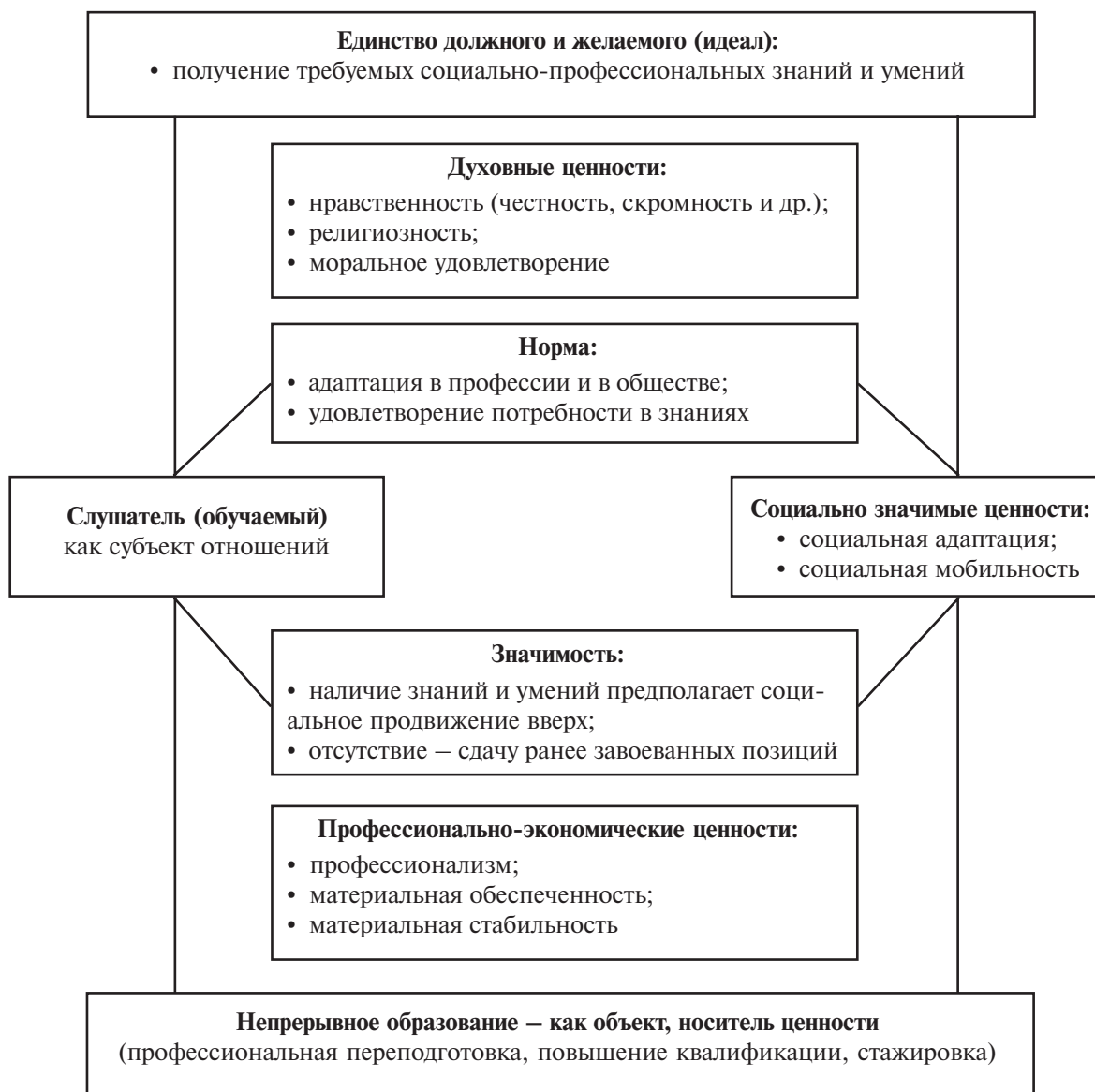
Рис. 1. Модель ценностных межсубъектных отношений в процессе профессионального образования

ществе, избранной профессии и специальности, создают условия в профессиональной социализации личности близкие к идеальным. Если этого стержня нет, то и человек, специалист, и целый коллектив профессионалов специальных видов государственной службы перестают быть самими собой.