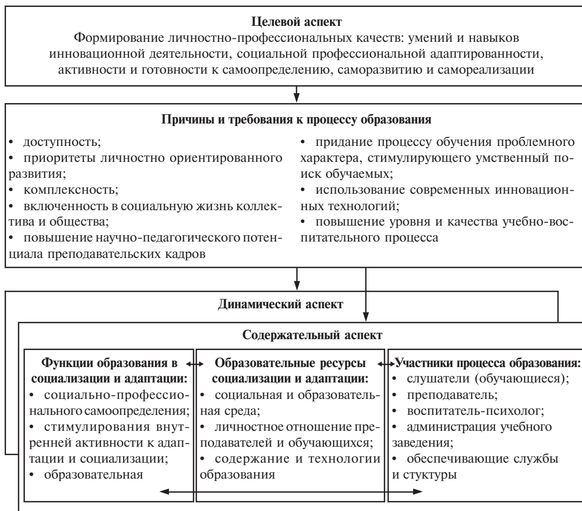
Рис. 3. Модель образовательных условий профессиональной социализации специалистов

Модель, положенная в основу профессиональной подготовки и содержания образовательных программ, может стать основой и для модели профессионального образования специалиста в информационном обществе.