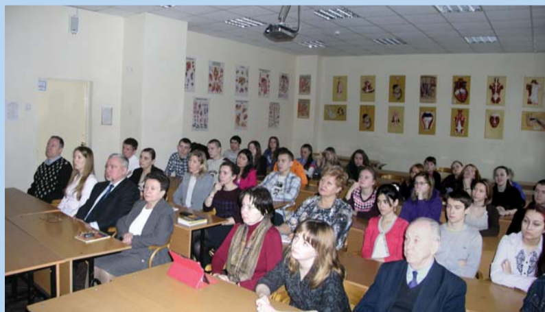
Участники вебинара – преподаватели и студенты факультета безопасности жизнедеятельности

Необходимость организации и проведения цикла вебинаров продиктована тем, что модернизация российского образования предполагает, в первую очередь, значительное обновление содержания общего образования, приведение его в соответствие с требованиями времени и задачами развития страны. За годы существования учебного предмета «Основы безопасности жизнедеятельности» (ОБЖ для школ) и дисциплины «Безопасность жизнедеятельности» (БЖД для средних профессиональных и высших учебных заведений)