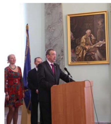
Ректор Герценовского университета поздравляет участников проекта