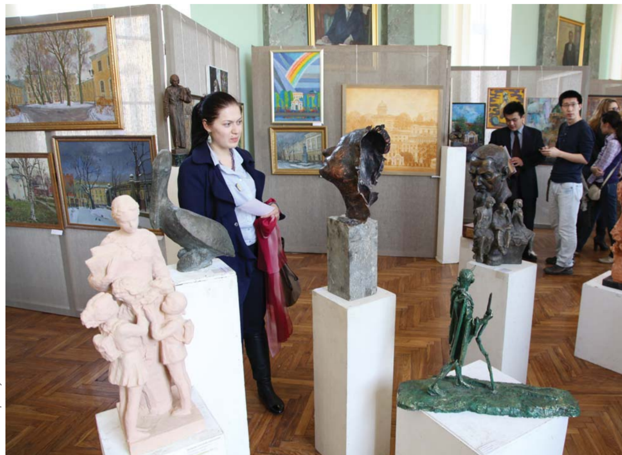
На экспозиции выставки «Герценовский университет в сердце Петербурга»

24 апреля в Голубом зале при поддержке Союза художников России состоялось торжественное открытие выставки «Герценовский университет в сердце Петербурга». Были представлены работы – номинанты одноименного международного конкурса, посвященного 215-летию Герценовского университета.