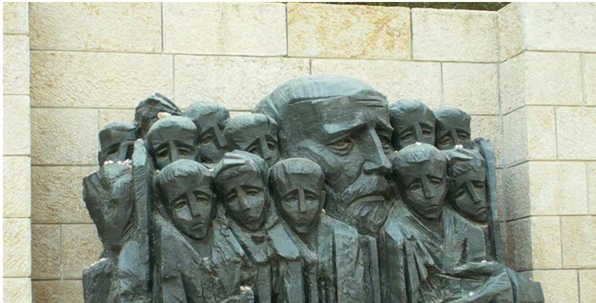
Памятник «Я. Корчак с детьми», Б.Сакциер, Иерусалим

7 ноября в рамках программы конференций «Дни Януша Корчака в Санкт-