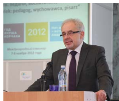
Генеральный консул Республики Польша в Санкт-Петербурге П. Марциняк