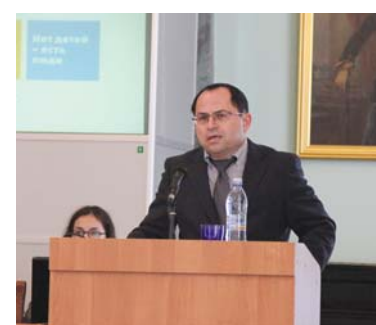
Генеральный консул Государства Израиль в Санкт-Петербурге Э. Шапира