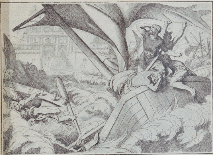
Гибель русскаго флота подъ Царьградомъ.