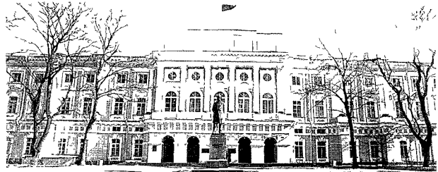
205 лет Герценовскому Университету