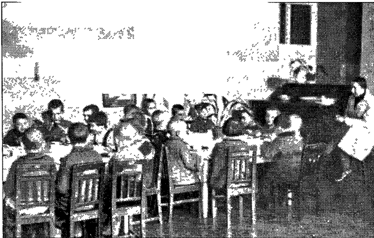
Детский сад на территории ЛГПИ им. Герцена. 19 февраля 1942 г.

В начале войны развернула деятельность лаборатория по изготовлению зажигательных смесей для борьбы с танками про-