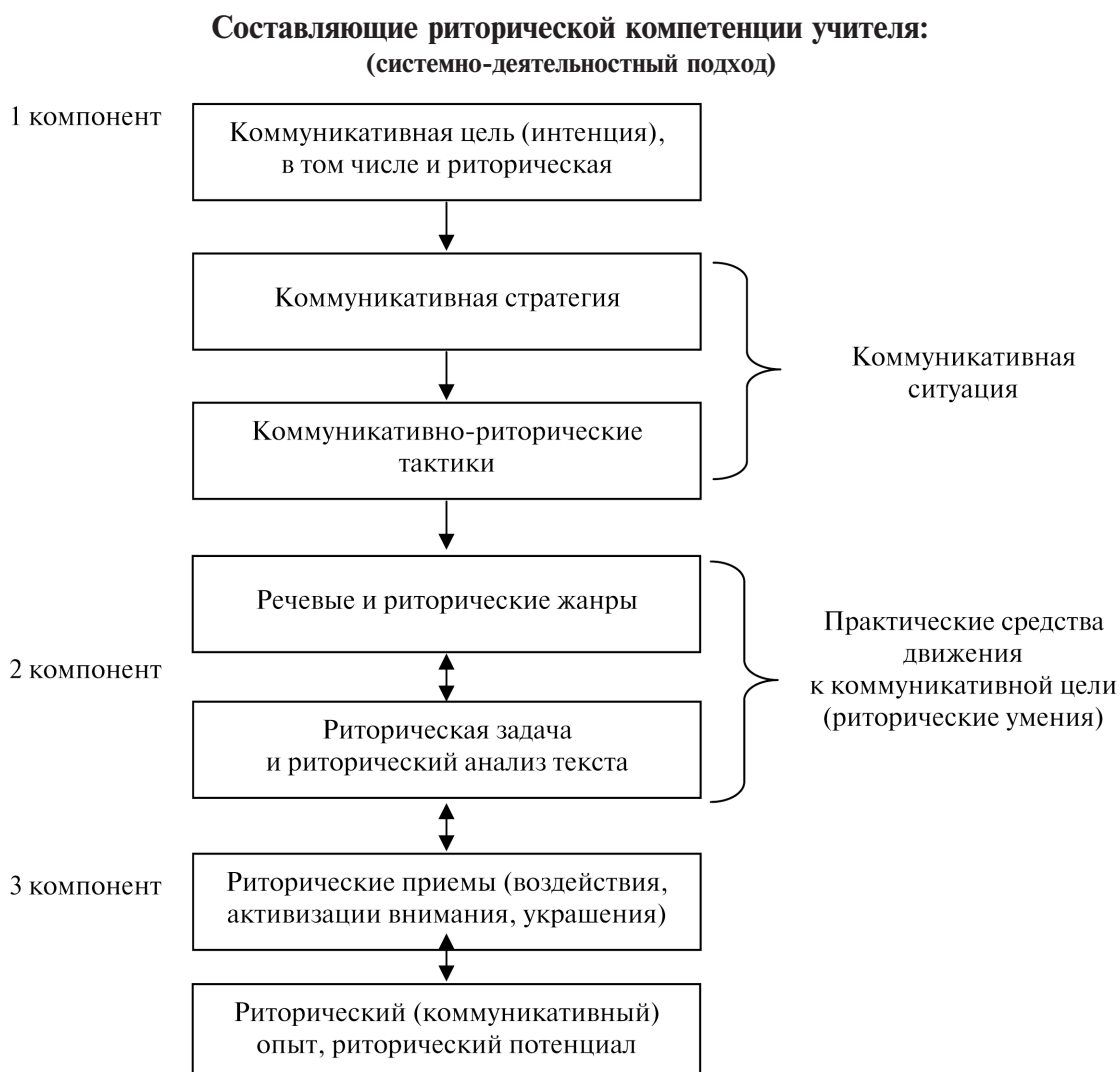
Рис. 2. Составляющие риторической компетенции учителя

Для возникновения установки необходима потребность субъекта и ситуация ее удовлетворения. Рассматривая формирование установки вслед за Д. Н. Узнадзе, мы считаем, что установка личности отличается от мотивации внутренним, самостийным началом, она появляется не только под воздействием действительности, но и слова/речи. Обучающий эксперимент показал: на занятиях риторики большинство студентов испытывает потребность в самоусовершенствовании, самообразовании, в изменении своих нравственных качеств. Учебно-речевые ситуации, речевые упраж-