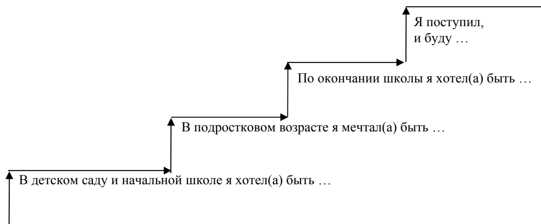
Рис. 1. Опросник «Лесенка профессиональных планов»