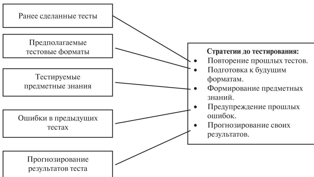
Рис. 1. Стратегии в период подготовки к тесту

Стратегии в период подготовки к тесту, т. е. до тестирования могут, быть показаны графически следующим образом (рис. 1):