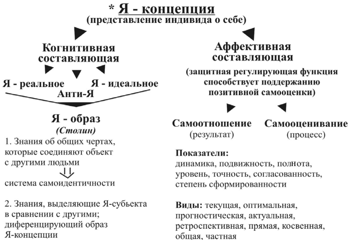
Рис 1. Структура самосознания