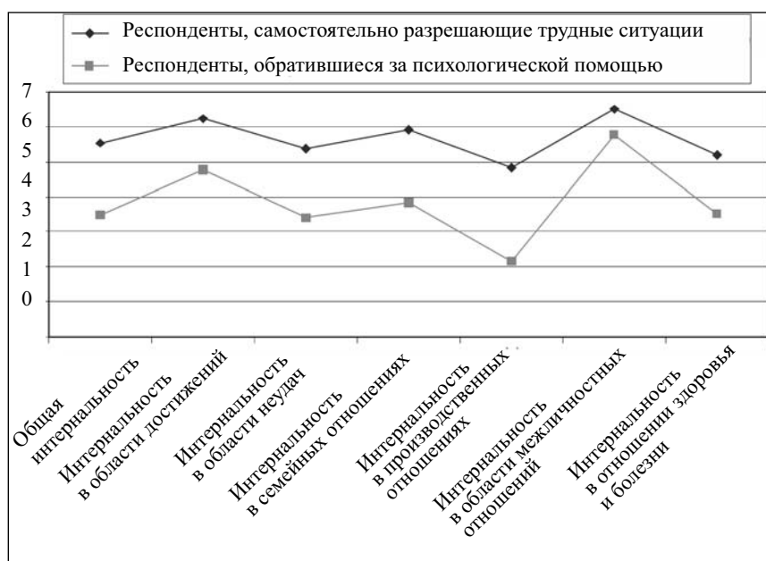
Рис. 2. Диаграмма средних значений по тесту УСК для двух групп респондентов (обратившихся за психологической помощью и разрешающих трудные ситуации самостоятельно)

недовольны своей жизнью, по сравнению с респондентами, самостоятельно решающими свои проблемы, при этом они меньше берут ответственность за качество своей жизни на себя. Учитывая то, что по параметру «ожидаемое отношение от других» у респондентов, обратившихся за психологической помощью, также обнаружены значимые различия с самостоятельно справляющимися с трудными ситуациями респондентами, можно предположить, что они не доверяют другим людям и ожидают от них негативных оценок. Анализ данных по тесту самооценки и тесту WIPPF позволяет предположить, что респонденты, обратившиеся за психологической помощью, высоко себя оценивая, не готовы строить доверительные отношения с окружающими. Этот вывод основывается на наличии значимых различий по параметрам «контакты» и «доверие», так как согласно данным, респонденты, обратившиеся за психологической помощью, являются более подозрительными и недоверчивыми по сравнению с испытуемыми, самостоятельно справляющимися с трудными ситуациями.