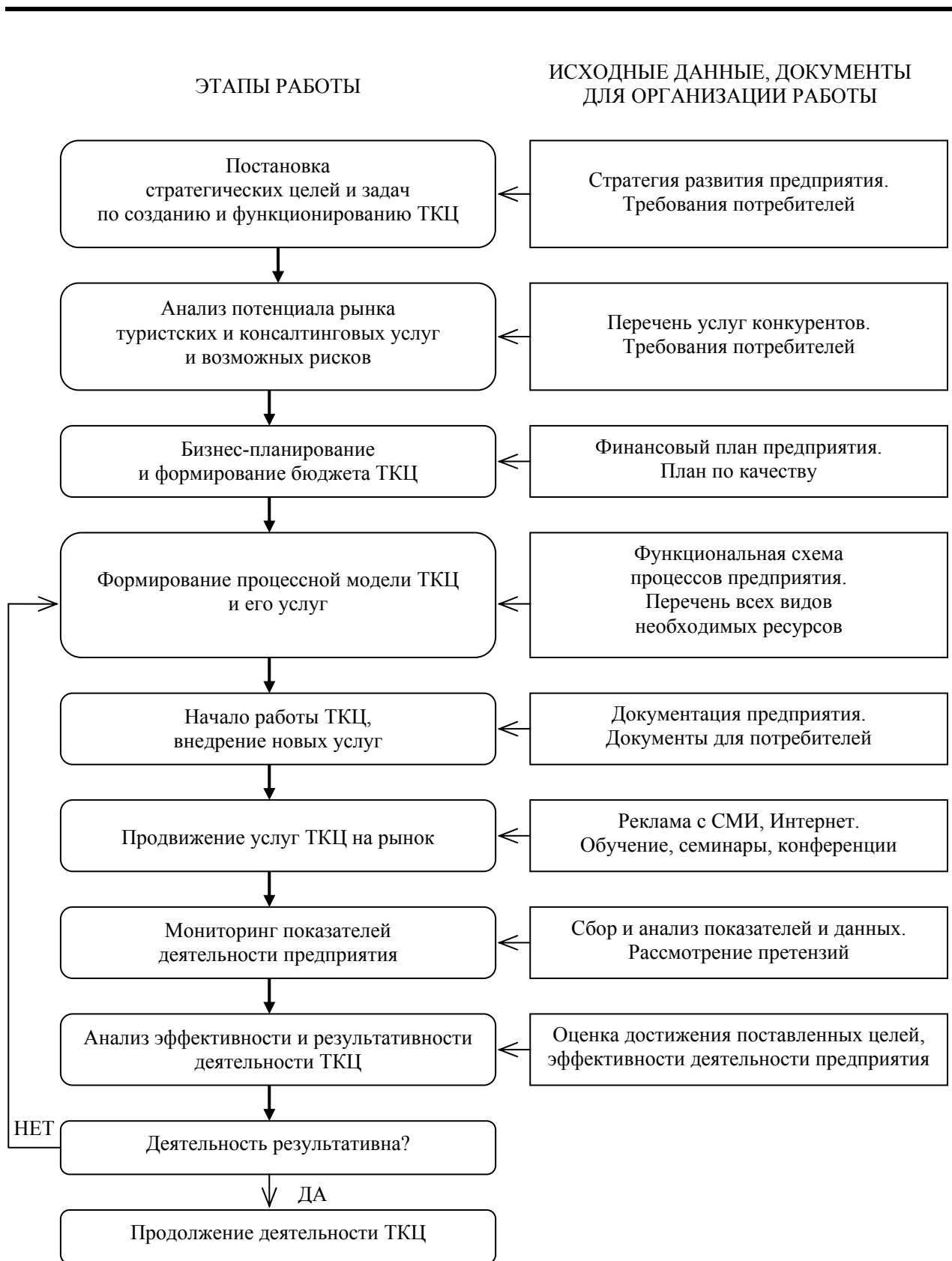
Рис. 2. Блок-схема создания ТКЦ