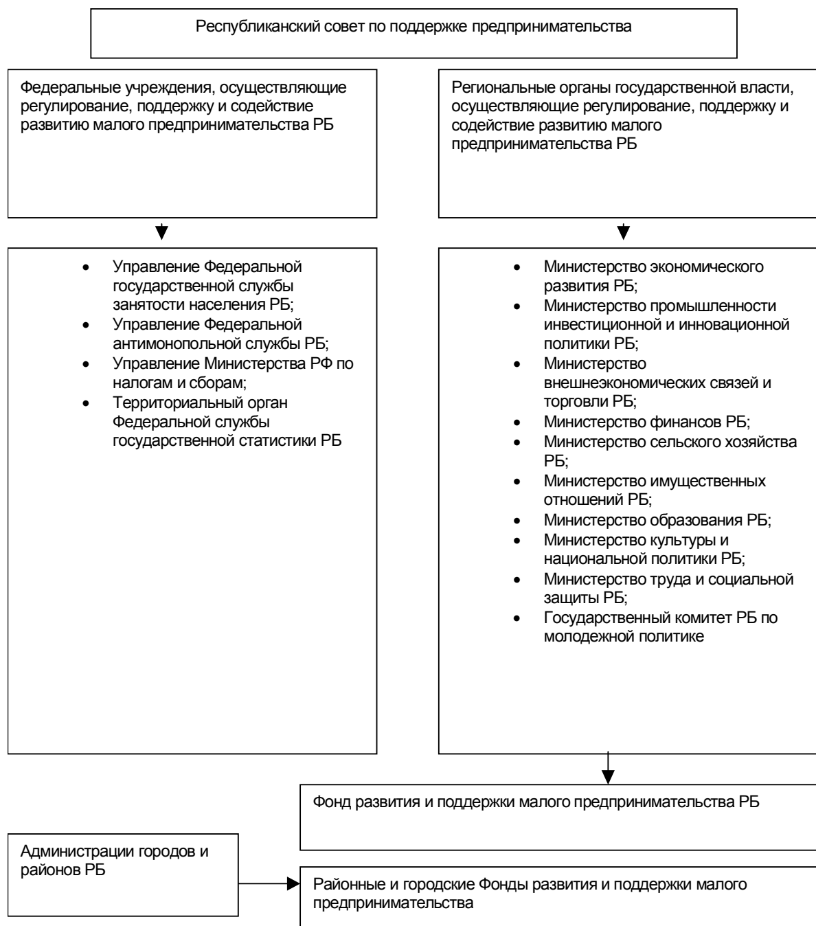
Схема 1. Организационная структура органов государственной власти, осуществляющих регулирование, поддержку и содействие развитию малого предпринимательства Республики Башкортостан

и Министерство промышленности инвестиционной и инновационной политики РБ (схема 1). Сейчас в каждом министерстве и ведомстве республики имеется отдел, отвечающий за малое предпринимательство.