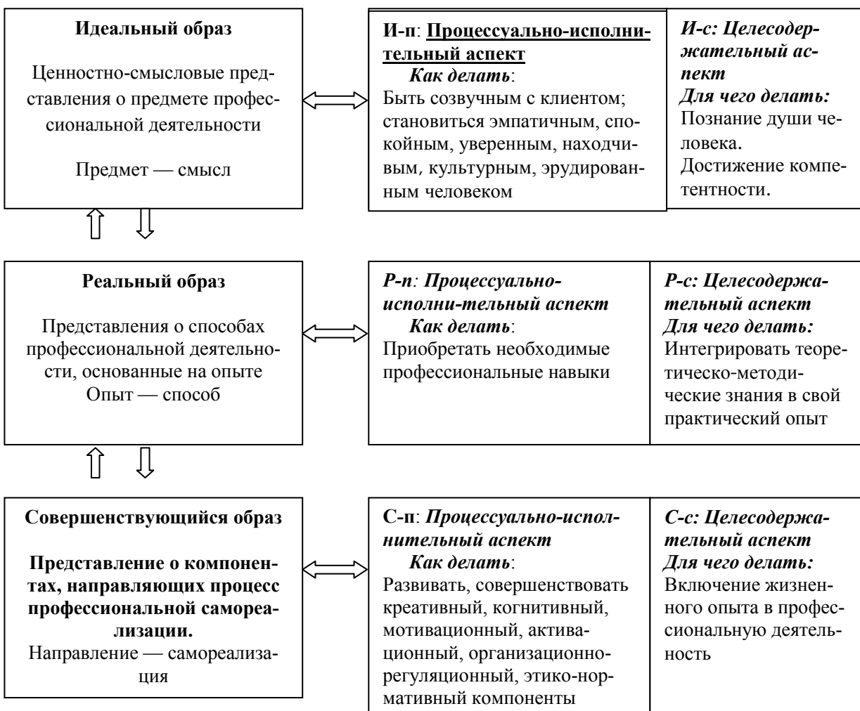
Рис. 1. Феноменологический образ психолога-консультанта

«для чего делать?», и процессуальному — «как делать?». В этих вопросах выражена профессиографическая сущность данной модели и проясняются смысл, ценности, цели, способы и направления развития в профессиональной деятельности в представлении респондентов. «Совершенствующийся образ» можно рассматривать как регулирующий, оперативный в структуре феноменологической модели специалиста, соединяющий «идеальный образ» — смысловую суть, предмет профессиональной деятельности и «реальный образ» — способ (способы) ее осуществления в соответствии с имеющимся на данный момент профессиональным опытом.