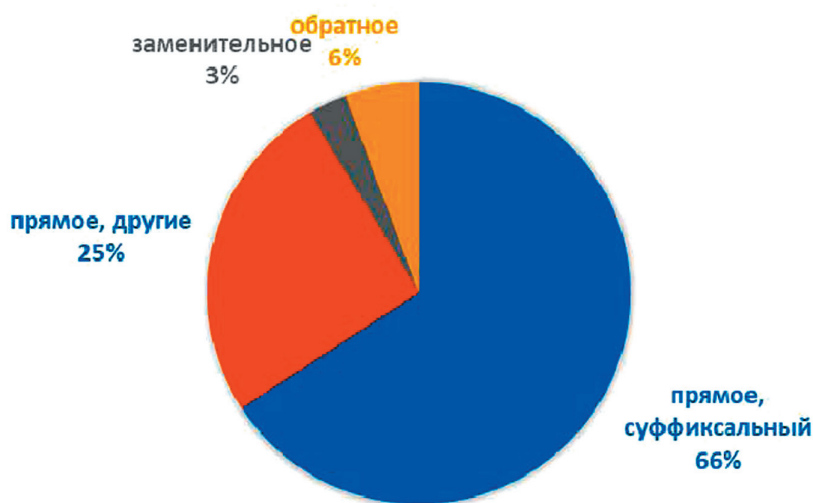
Рис. 3. Направления деривации и способы словообразования

Некоторые окказионализмы внешне совпали с отмеченными словарями, но редкими