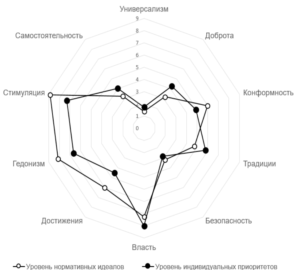
Рис. 1. Ценностные профили подростков на уровне нормативных идеалов и индивидуальных приоритетов

людей ценностных ориентациях, ожидаемыми явились данные о незначимых ценностных ориентациях для респондентов. Так и на уровне нормативных идеалов, и на уровне индивидуальных приоритетов ранги незначимых ценностных ориентаций получили власть, стимуляция, гедонизм, которые характеризуют стремление личности к самоутверждению, получению удовольствий, новизне и глубоким переживаниям. Однако отмечается одно отличие в наборах двух уровней незначимых ценностных ориентаций, а именно на уровне нормативных идеалов достижение исключено респондентами из приоритетных жизненных принципов, хотя в деятельности на уровне индивидуальных приоритетов принимает более значимое место. И наоборот, традиции, располагаю-