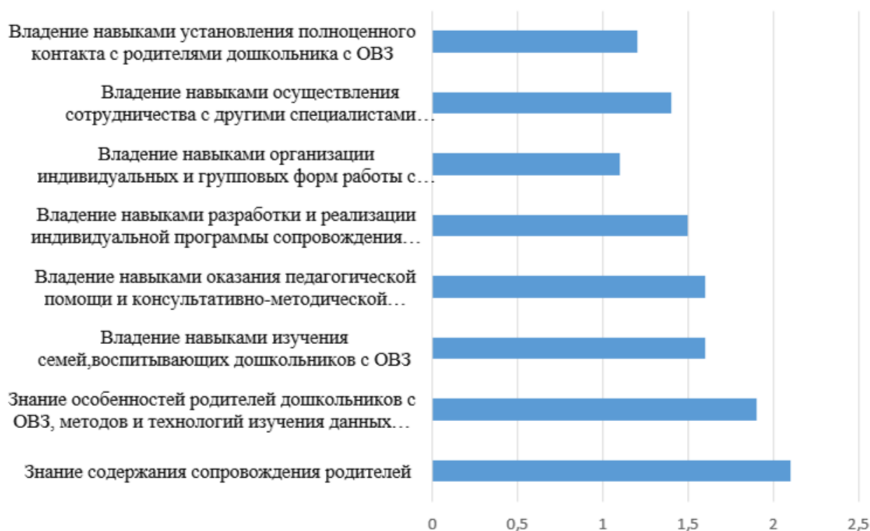
Рис. 2. Результаты общего мнения экспертов о сформированности профессиональных знаний, умений и навыков организации сопровождения родителей дошкольников с особыми образовательными потребностями у студентов направления подготовки «Специальное (дефектологическое) образование»