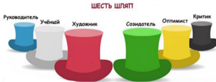
Рис. 1. Шляпы

Часто для решения проблемной ситуации лучше подключать различные типы мышления. Давайте разберём проблемную ситуацию по методу «Шесть шляп». Выберите себе шляпу, а следовательно, и роль. Обсудим!