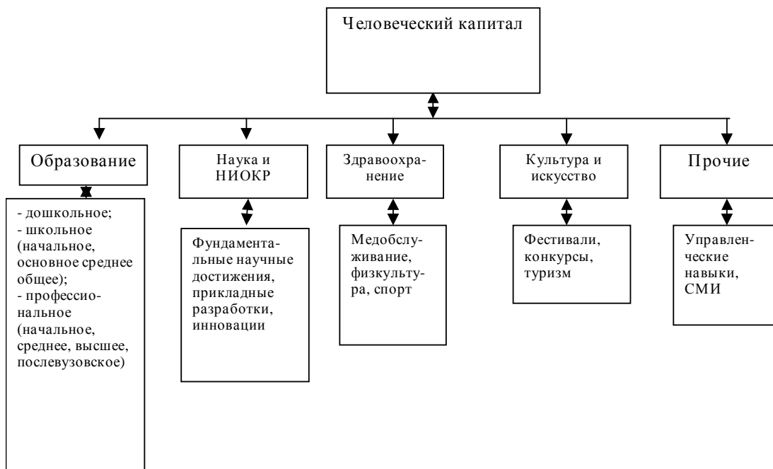
Рис. 2. Классификация системообразующих элементов человеческого капитала

новное производственное отношение современного общества в его формальных модификациях, выделяет следующие превращенные его формы: производственный, потребительский и интеллектуальный. Производственный и интеллектуальный капитал создают поток услуг, потребление которых содействует общественной полезности. Эта классификация рассмотрена с точки зрения характера содействия экономическому благосостоянию общества 3 . Существует и другая классификация форм человеческого капитала – по элементам затрат. В ней выделяются как составляющие капитал образования, капитал здоровья и капитал культуры. Г. Т. Аширова придерживается данного подхода, но кроме образования, здоровья и культуры она вносит в составляющие еще науку и НИОКР (рис. 2) 4 .