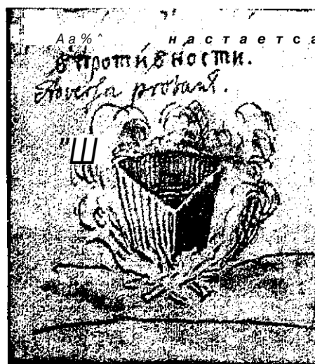
Рис. 3. Черновик рисунка Я. Я. Штелина к коронации

Жертвенные кадила изображались в разных ситуациях. Большое кадило было нари-