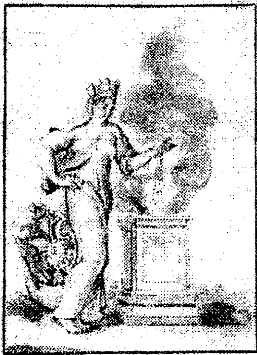
Рис. 4. Рисунок к коронации Петра II

ной на голове также использовался ранее в эмблемах 1728 г. Их религиозная составляющая заключалась в том, что в них символическая Российская империя стояла на коленях перед жертвенником, на котором дымился огонь. В приложении приведена эмблема 1728 г., на которой изображение Россия не преклоняется перед жертвенником, однако эта символическая композиция практически полностью соответствует описанию 1738 г. (рис. 4) 1 . Как отмечалось, в