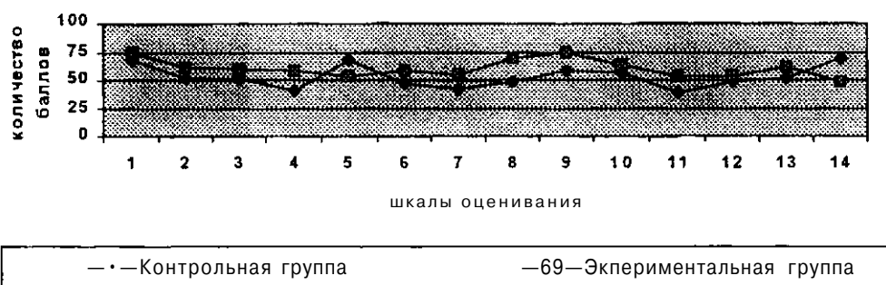
Рис. 1. Различие уровней самооценок результатов учебного труда студентов в экспериментальных и контрольных группах

Чтобы избежать усредненно-бесполюх показателей, нейтрализующих тенденции поведения, обусловленные полом испытуемого, были сравнены самооценки результатов учебного труда отдельно юношей и девушек.