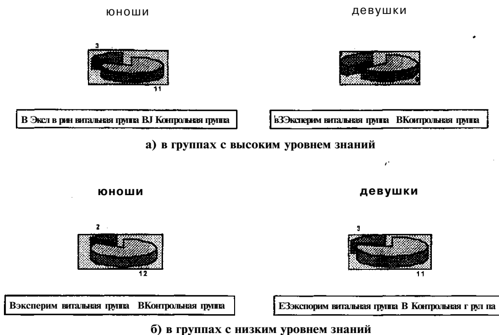
Рис. 2. Различия уровней самооенок результатов учебного труда юношей и девушек в экспериментальных и контрольных группах