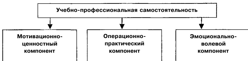
Рис. 1. Структурные компоненты учебно-профессиональной самостоятельности

Проведенный анализ позволил нам выделить следующие компоненты учебно-профессиональной самостоятельности (рис. 1).