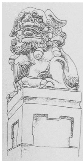
Рис. 3. Сидящий лев