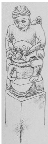
Рис. 5. Человек, сидящий на спине льва