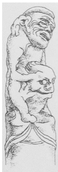
Рис. 6. Человек, сидящий на спине льва

искусства (рис. 7). Каждую группу еще можно разделить на несколько подгрупп.