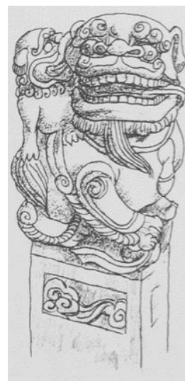
Рис. 4. Сидящий лев с львенком

б) изображения человека и животного. По существующему канону изображения скульптуры человека на вершине коновязей имеют несколько разных «поз»: склоненные фигуры, устремленные вперед, или сидящие в естественной позе, или облокотившиеся на что-то. Наездники имеют разные головные уборы или головные платки, а также косы. На них изображены разнообразные одежды- халаты или короткие куртки, некоторые из них держат в руках плеть, трость «Жуи», музыкальные инструменты, курительную трубку и др. Все эти скульптуры чрезвычайно образны и выразительны. Некоторые изображения людей держат за голову льва или за рога быка. Их позы очень просты и живы. Некоторые сидят верхом на животных: чаще всего на львах, лошадях, слонах и др. У некоторых на плече находится орел, обезьяна, молодой лев и другие животные, которые играют с человеком, выражают привязанность к своему хозяину (рис. 5, 6). Обычно между передними ногами и грудью животных высекают круглые дыры для того, чтобы привязывать скот;