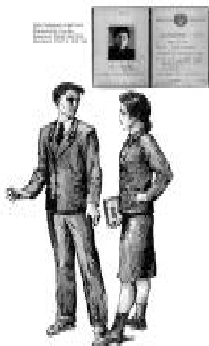
Рис. 1. Форменная одежда финансистов

ное и советское руководство страны подчеркнуло внешними атрибутами. Государственную важность работников системы Министерства финансов СССР политическое руководство отметило формой серо-зеленого цвета (берет, китель, юбка или брюки, шинель) и знаками различия (рис. 1). Эта униформа полагалась и работникам сберегательных учреждений. Для служащих высшего,