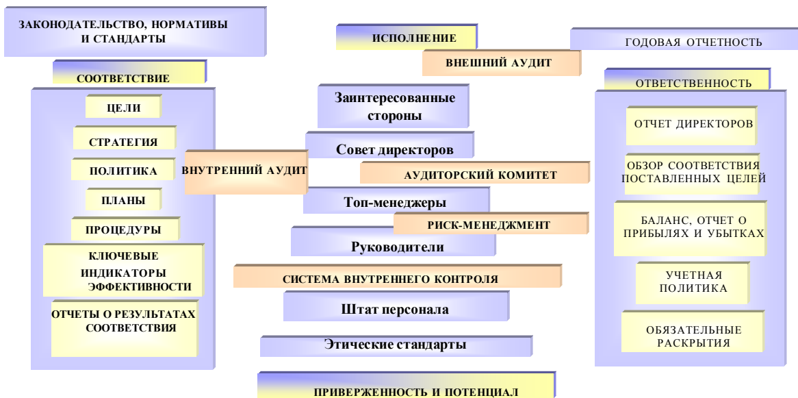
Рис. 3. Модель корпоративного управления (2)

Что касается системы внутреннего контроля, то существует обоснованное убеждение, что всем крупным компаниям следует принимать такую структуру внутреннего контроля, которая позволит излагать собственное видение ситуации. Это обеспечивает формирование стратегии в отношении контрольной среды, взаимоотношений между людьми, корпоративных структур и процессов управления, упомянутых выше. В контексте системы внутреннего контроля компании следует организовать процесс идентификации, оценки и управления рисками и выстраивать, таким образом, систему риск-менеджмента.