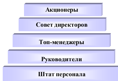
Рис. 1. Базовая модель корпоративного управления

Согласно положениям теории агентских отношений корпоративные структуры управляются Советом директоров, который, в свою очередь, назначается собственниками, т. е. акционерами. Совет директоров формулирует корпоративную стратегию для достижения поставленных целей и оправдания рыночных ожиданий и набирает менеджеров и штат персонала для ее реализации. Простейшая базовая модель управления (рис. 1) вполне эффективна для работы, если каждый участник абсолютно компетентен и честен в своей работе.