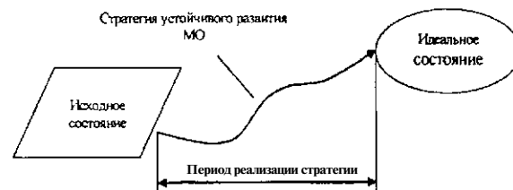
Рис. 1. Процесс реализации стратегии [1]

переход от одного этапа разработки и реализации стратегии к другому.