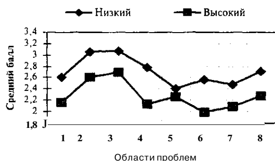
Рис. 3. Проблемная озабоченность в различных областях жизни у подростков из семей с разными семейными доходами

На основании вышеизложенного в нашем опроснике был сформулирован вопрос: «Какой средний доход в месяц в твоей семье?» - меньше 1000 юаней; 1000-2000 юаней; 2000-3000 юаней; 3000-4000 юаней; 4000-5000 юаней; 5000-ЮОООюаней; больше 10 000 юаней. Далее мы разделили подростков на три группы согласно доходу семьи в месяц: группа с семейным доходом меньше 1000 юаней (низкий доход); группа с семейным доходом от 1000 до 10 000 юаней (средний доход); группа с семейным доходом более 10 000 юаней (высокий доход). Затем мы сравнили подростков из семей с высоким и низким доходом по степени их проблемной озабоченности и получили результаты (табл. 2 и рис. 3).