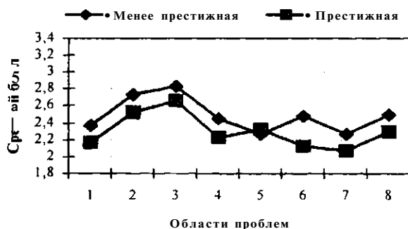
Рис. 2. Проблемная озабоченность подростков, у родителей которых профессии с разной престижностью

Из-за отсутствия социальной поддержки, низкого уровня образования они не в состоянии оказать детям необходимую помощь в обучении и т. д. С целью выяснения профессионального статуса родителей подростков мы использовали вышеизложенную классификацию, ныне популярную в исследовании социального положения китайских граждан. Мы определяем первые 3 вида профессии как социально престижными, последние 3 вида профессии менее престижными. Мы сравнили эти две группы и получили следующую информацию (см. табл. 2. и рис. 2).