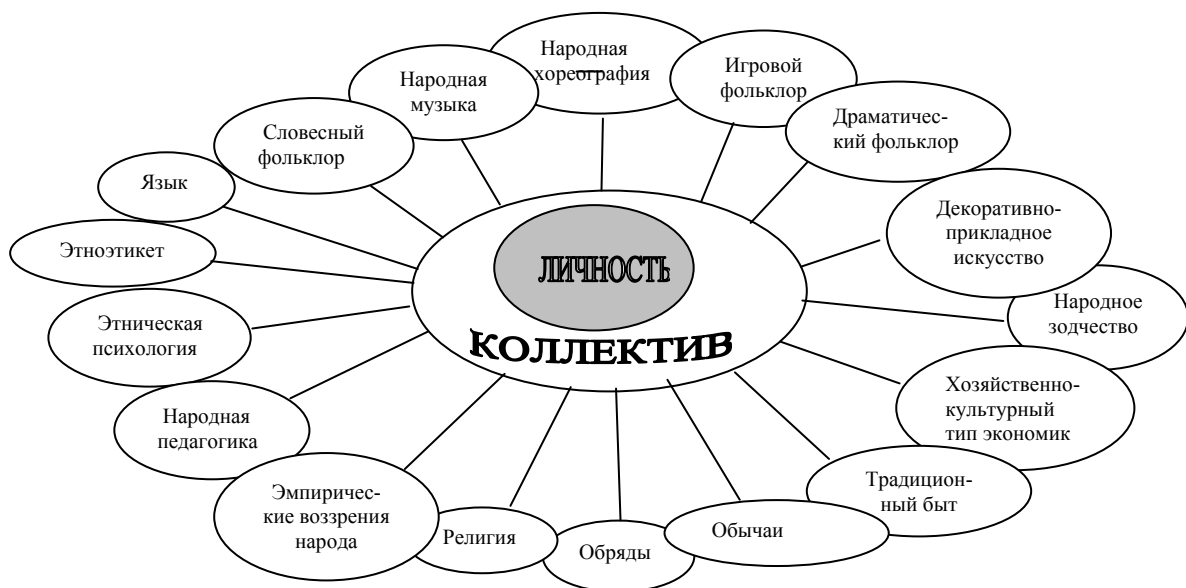
Рис. 1. Структурная модель этнокультуры

В русской традиционной культуре личность с каждой из областей связана через коллектив, так как здесь индивидуальное начало растворено в групповом (семья, крестьянская община, трудовая артель, сообщество приходской церкви). Коллективность сознания многими учеными характеризуется как «соборность» (А. Хомяков, В. Соловьев, Н. Бердяев). Она проявляется в массовых семейно-бытовых и календарных обрядах, в преобладании коллективных форм народного творчества, во всеобщем единении в хоровом пении во время церковной службы, в ансамблевом пении в будни и в дни народных праздников, свойственном большинству песенных жанров, в стремлении найти защиту в коллективе в трудную минуту.