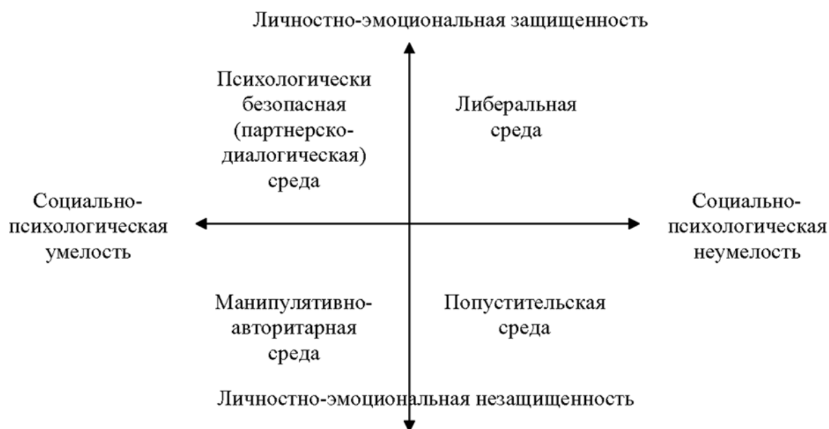
Рис. 1. Структурная модель социальной среды (психологическая характеристика)

Концептуальные положения по созданию психологической безопасности социальной среды, критерии и принципы ее моделирования дают нам основания для создания структурной модели социальной среды в ее психологическом аспекте (рис. 1).