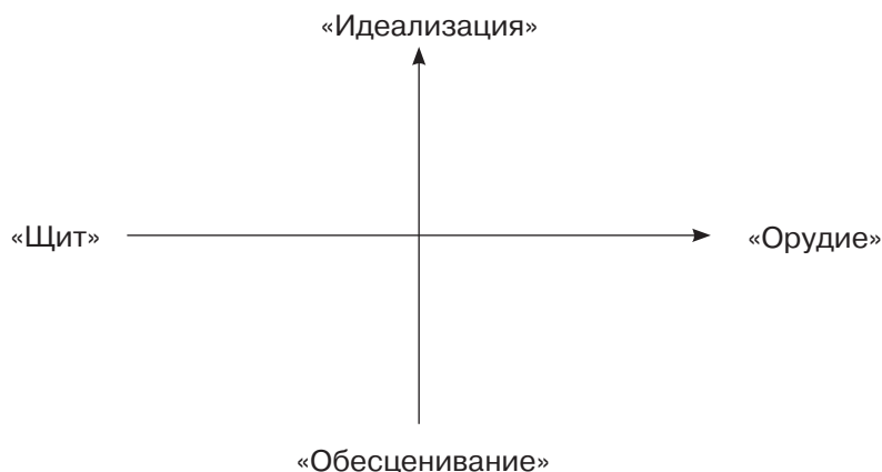
Рис. 2. Модель «Роль профессиональной этики в деятельности психолога»

значении и месте профессиональной этики в работе помогающего специалиста. В нашем исследовании феноменологический анализ эссе позволил выявить различия в индивидуальном видении респондентами роли профессиональной этики психолога в его деятельности и структурировать ответы студентов, представив их отношение к этическим канонам деятельности психолога в виде модели (рис. 2). При изучении эссе были выделены суждения студентов, разводящих их отношение к профессиональной этике по двум различным осям, которые касались уровня использования этических принципов в профессиональной деятельности психолога и направления их использования.