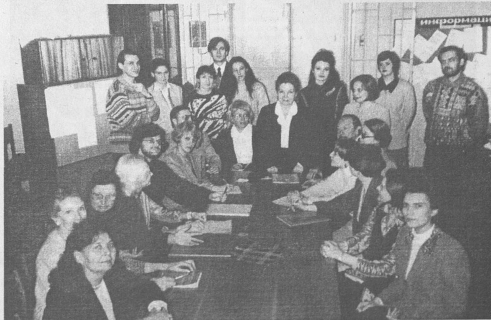
На снимке: сотрудники кафедры Фото Н.Бояркиной.

Именно там стали развиваться научные направления по культурологии искусства, или теории и истории художественной культуры, и складываться соответствующие вузовские