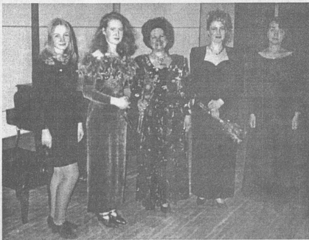
На снимке: участники концерта в университете С. Айовы