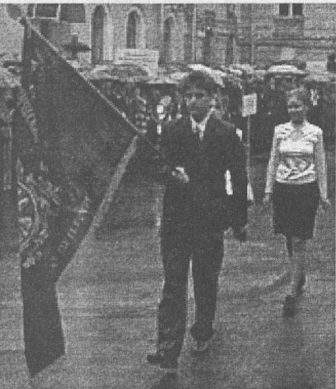
На снимке: вынос знамени университета.

1-го сентября перед студентами выступили: зам. председателя Комитета по науке и высшей