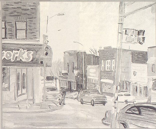
А.И. МАЖУГА Колледж - хилл холст, масло

степень уважительности к ученикам и поощрение творческого начала здесь гораздо выше.