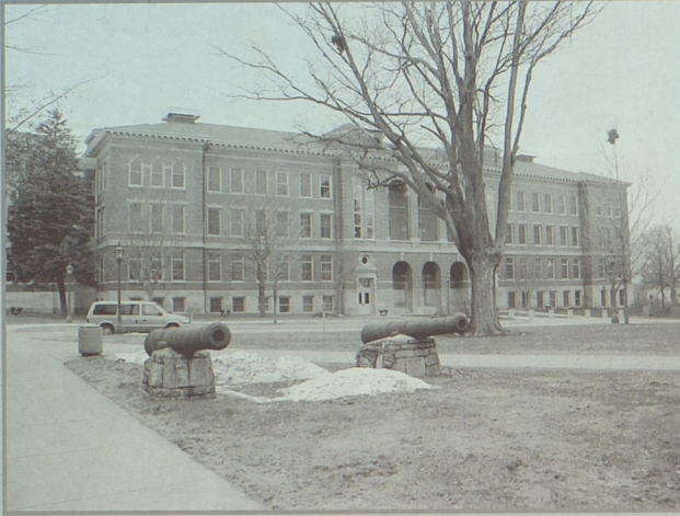
Университетское здание, с которого начиналась история университета Северной Айовы

Теперь у нас появилась возможность сравнить нашу и американскую систему художественного образования, выявить то, что их сближает и отличает.