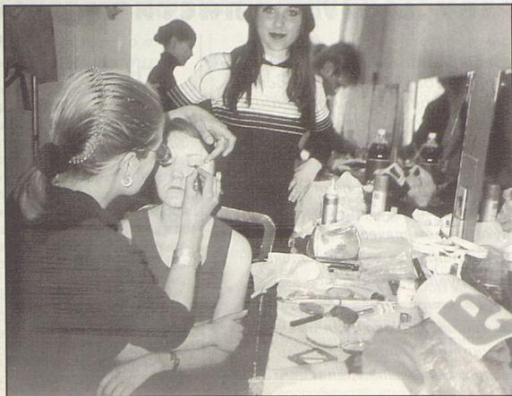
«Создадим новое лицо университету!» «День Университета». Художник клуба артирует артистов студенческого театра