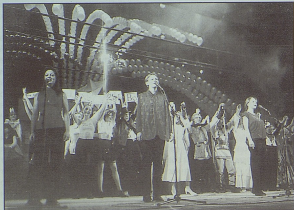
Праздник «День Университета» 14 мая 2001г. ДК им.Горького Вокалисты студенческого театра «Ювента» и выступавшие факультеты