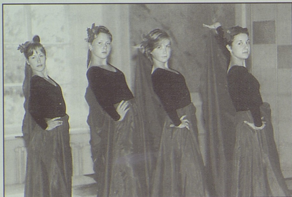
Студенческий театр «Ювента» (танцевальная студия)