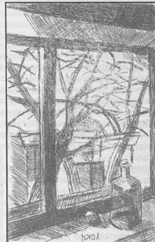
Р.МОРОЗОВ "Вид из окна офортной мастерской" 2 курс 5 группа ф-т изобразительного искусства