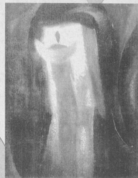
Андрей Корольчук «Уходящий», холст, масло, 1993