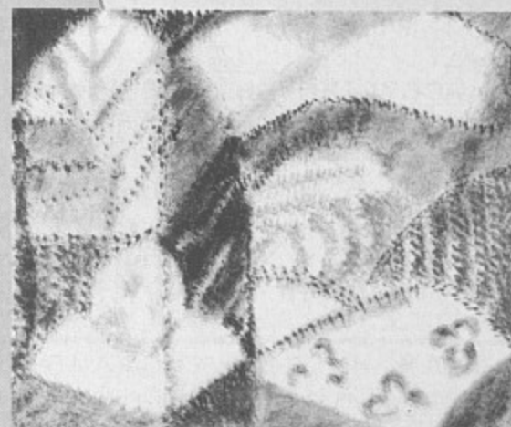
Виктория Маркевич «Пейзаж. Июль.», бумага, акварель, 2000