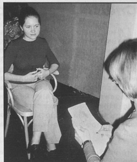
«Арт-галерея» ф-та изобразительных искусств

ной мечты – поступление на экономический факультет университета...” Абитуриент.