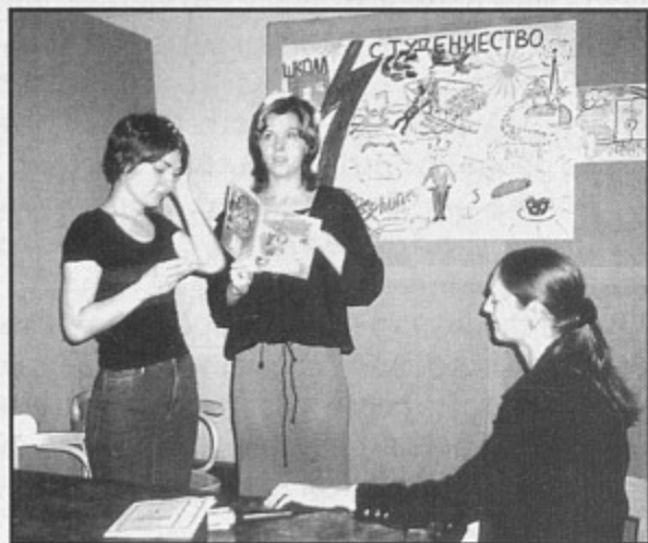
Презентация ф-та экономики