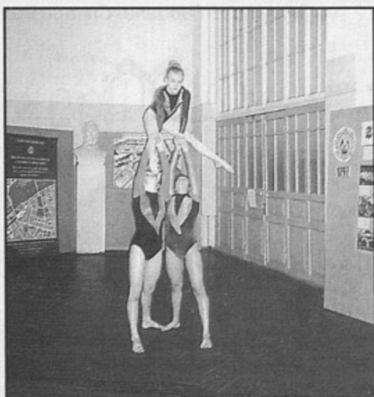
Презентация ф-та физической культуры

Хорошим духовным контекстом и визуальным фоном всего происходящего стала авторская фотовыставка "Мой университет" и