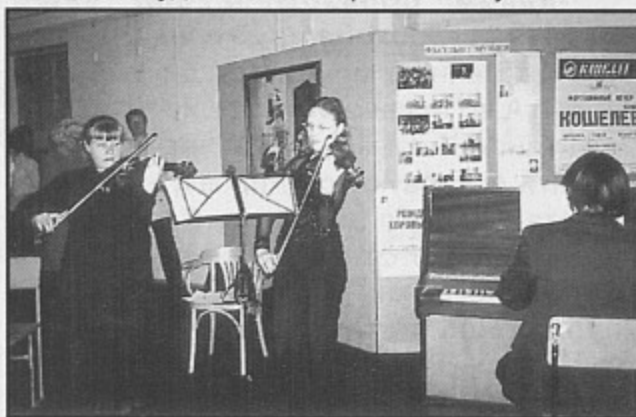
Музыкальный салон ф-та музыки