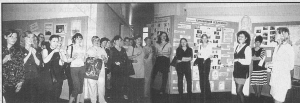
Презентация ф-та коррекционной педагогики

Каждый день работы приемной комиссии (с 21 июня по 14 июля) был посвящен какому-либо факультету. Открывал этот своеобразный парад факультет физической культуры. Дебютное