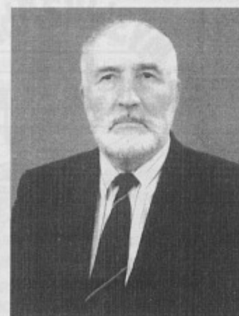
В. А. Абчук

является автором более 40 книг по экономике, менеджменту, маркетингу и прикладной математике, из которых более 25 опубликованы уже в последние десять лет.