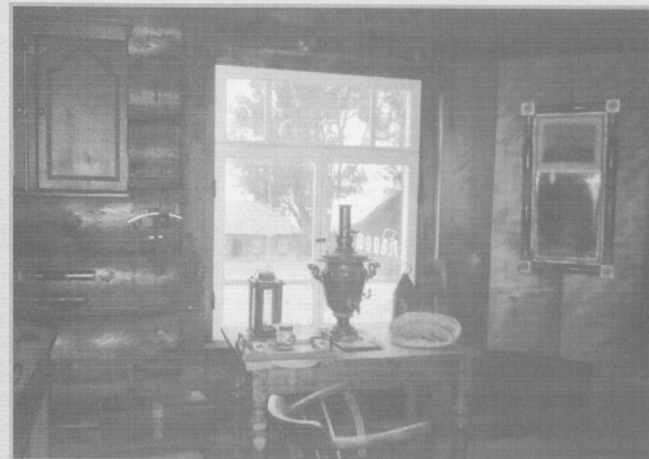
Интерьер дома Кускова