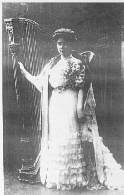
В этот вечер меня исполнили прекрасно, и мне было очень приятно играть на арфе.