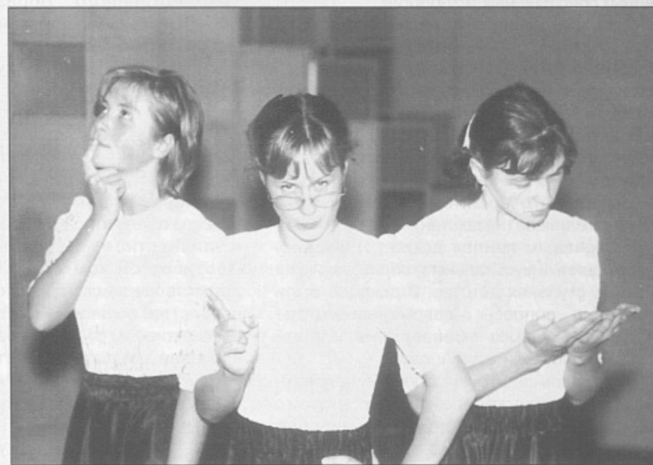
«Театр «ЮВЕНТА»