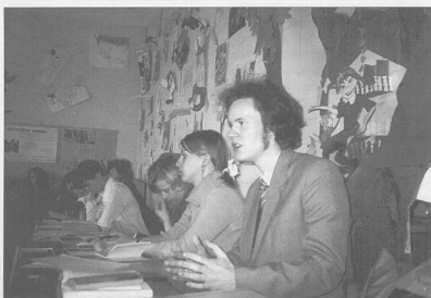
Заседание дискуссионного клуба на тему «Свои и чужие»

Срок подачи документов – месяц со дня опубликования объявления. Адрес: 191186, С-Петербург, наб. р. Мойки, 48, РГПУ им. А.И. Герцена, аттестационный отдел. Телефоны: 117-29-52; 312-22-95, добавочный 11-96.