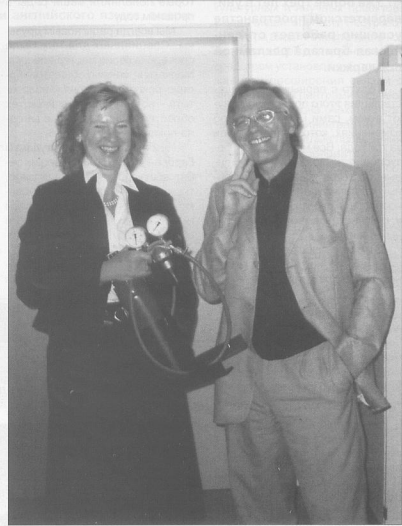
На фото: профессор университета г. Мюнстера Ханс Дитер Барке с супругой.